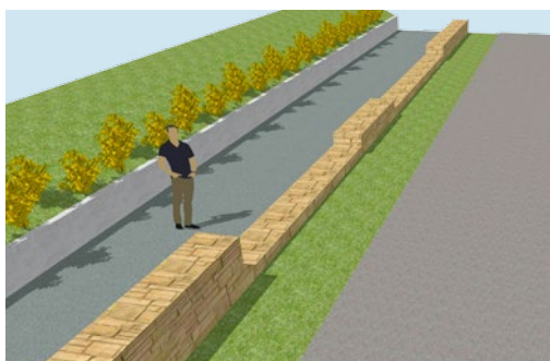
Projet après travaux

Elle avait peiné à démarrer du fait des difficultés du montage technique et juridique pour mener de front la restauration du mur patrimonial et la réalisation des murs de soutènement privés.