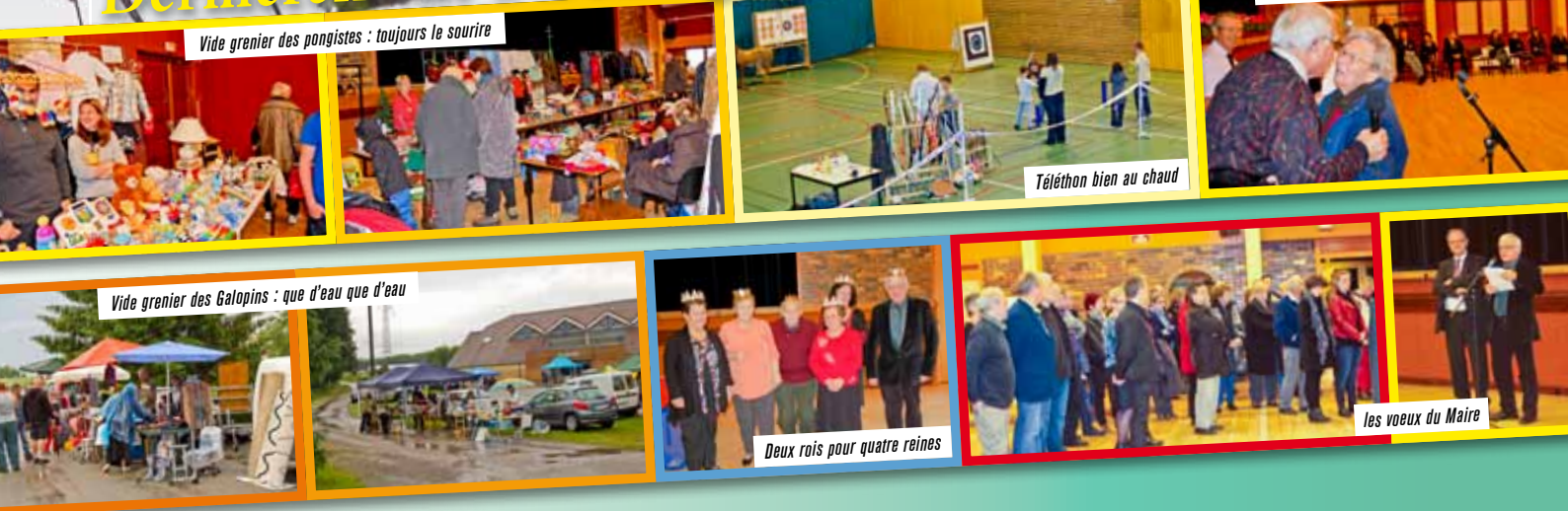
Vide grenier des pongistes : toujours le sourire