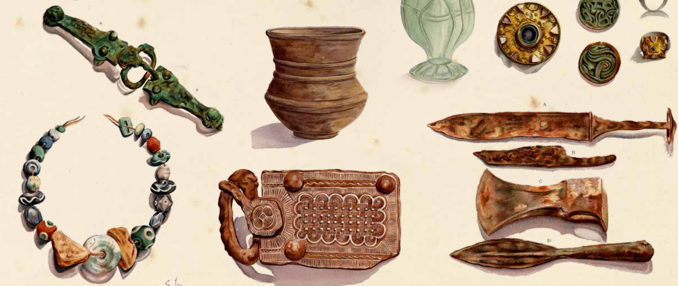
Documents sources extraits de « Fouilles du Cimetière Barbare » de Ferdinand SCHEURER et Anatole LABLOTIER - Editions BERGER-LEVRAULT, 1914.